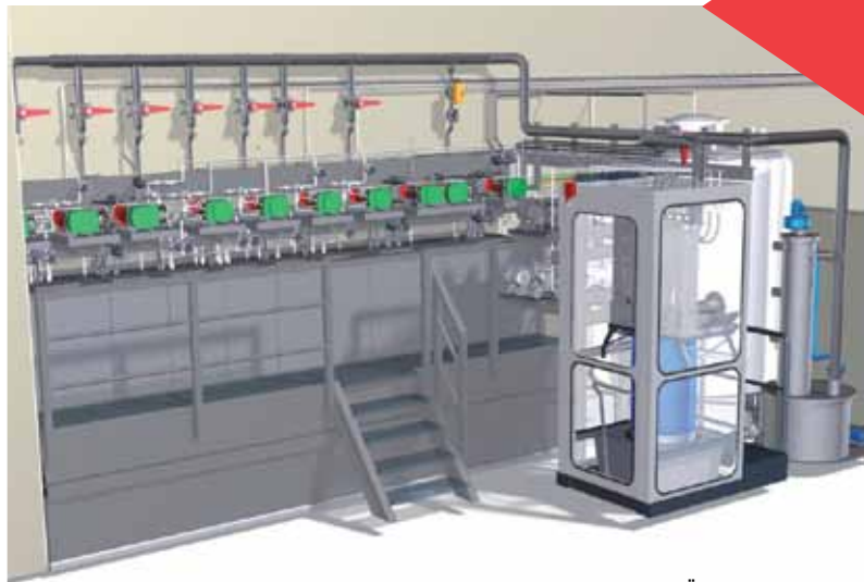
COVRA: CHEMICALIËN DOSEERSTATION